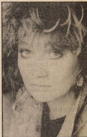
Adler Marian szerepében Básti Juli